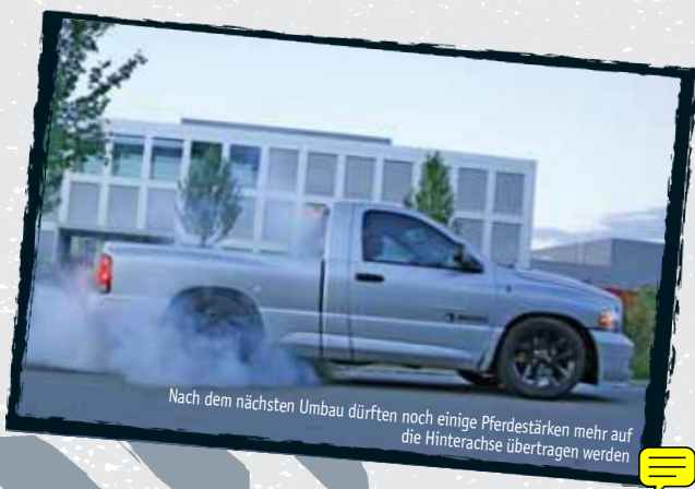
Nach dem nächsten Umbau dürften noch einige Pferdestärken mehr auf die Hinterachse übertragen werden