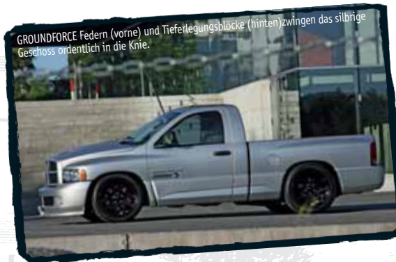
GROUNDFORCE Federn (vorne) und Tieferlegungsblöcke (hinten) zwingen das silbrige Geschoss ordentlich in die Knie.