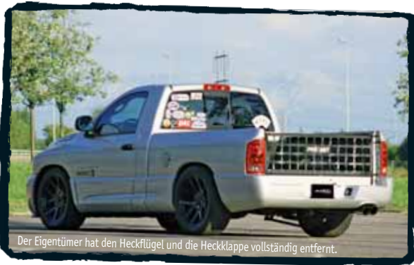
Der Eigentümer hat den Heckflügel und die Heckklappe vollständig entfernt.